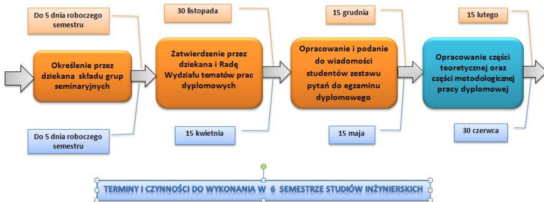
RYS. 2. PROCEDURA DYPLOMOWANIA, TERMINY I CZYNNOCI DO WYKONANIA W 5 SEMESTRZE STUDIÓW LICENCJACKICH LUB 6 SEMESTRZE STUDIÓW INŻYNIERSKICH