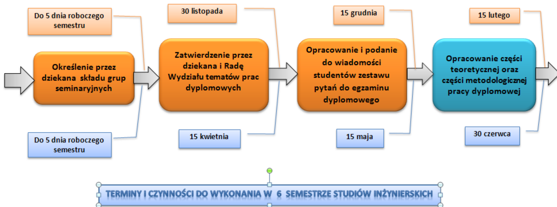
RYS. 2. PROCEDURA DYPLMOWANIA, TERMINY I CZYNNOCI DO WYKONANIA W 5 SEMESTRZE STUDIÓW LICENCJACKICH LUB 6 SEMESTRZE STUDIÓW INŻYNIERSKICH